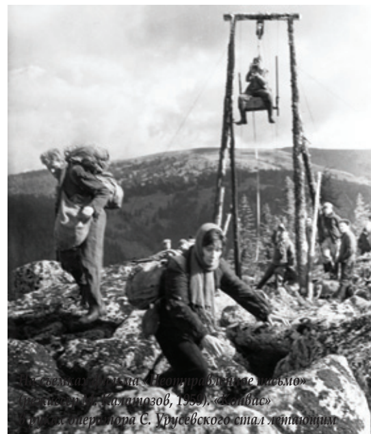
Изображение в фильме «Неотправленное письмо» (режиссер С. Урусевский, 1959), «Зеркальщик» оператора С. Урусевского стал лейтмотивом

Во многих фильмах шестидесятых–семидесятых годов динамичные кадры,